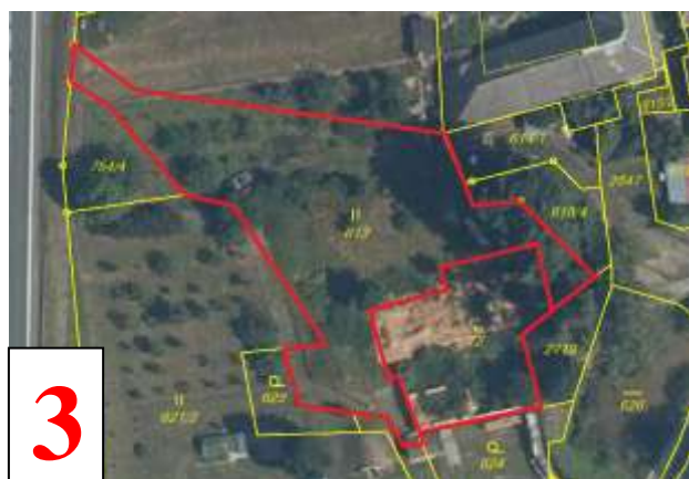
2174 m 2 Koclířov, spodní konec, p.č. st.72 (557m 2 ), p.p.č.613 (1617m 2 )