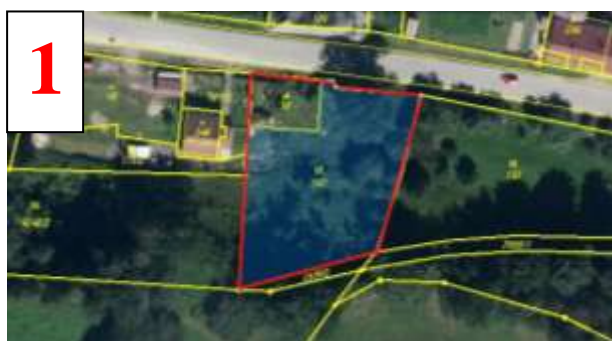
1680 m 2 Koclířov střed, p.č. 180 (po převodu st.p.č. 18 z UZSVM do vlastnictví obce se výměra zvětší o 219 m 2 )