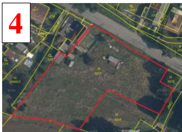
3873 m 2 Koclířov, horní konec, p.p.č. 92/3