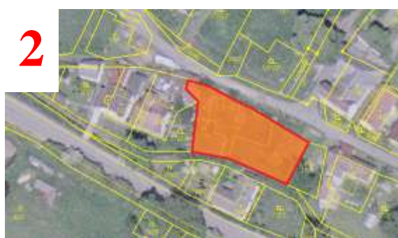
838 m 2 (cca 20x40m) Horní konec, p.č. 1772 (pronajatá).