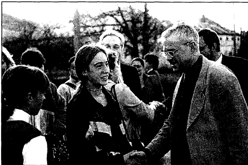
Ministr práce a sociálních věcí Vladimír Špidla při slavnostním uvítání v Koclířově.