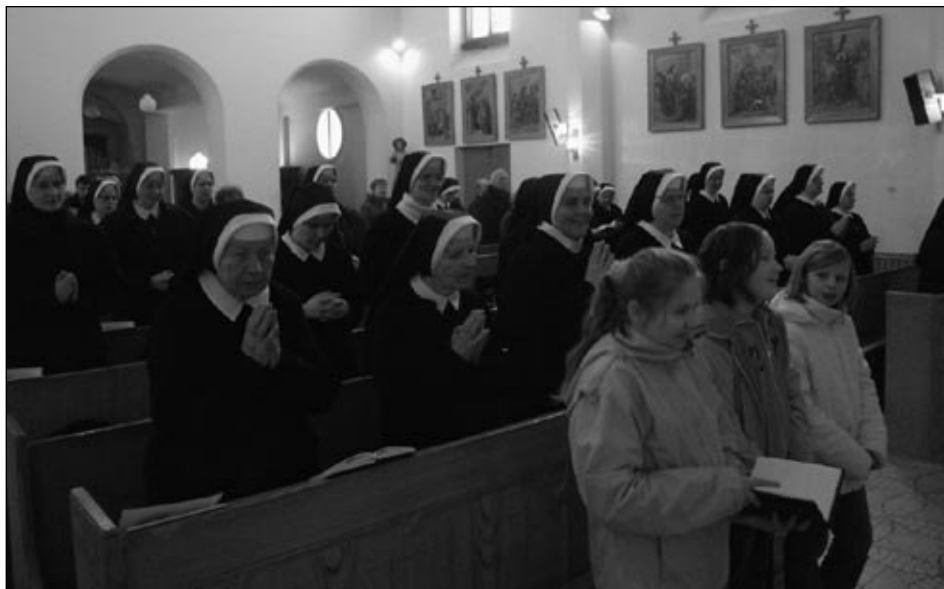
Nedělní mše sv. farnosti s řeholními sestrami, které v Koclířově prožívaly svoje duchovní cvičení ve dnech 5. - 11.3.

Každou středu celodenní adorace 8.00 - 18.00 hod. V postní době každý pátek křížová cesta ve 12.00 hod.