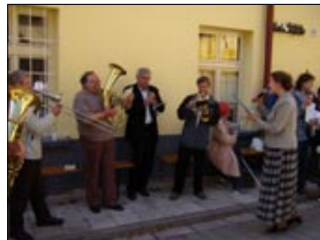
K poslechu i příjemné atmosféře hrála dechová kapela Petruška.