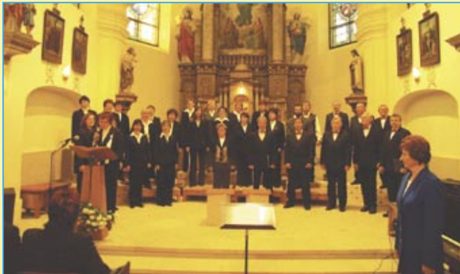
PS Dalibor Svitavy

V pátek 18. 5. 2007 se v našem farním kostele uskutečnilo společné vystoupení pěveckých sdružení Dalibor Svitavy a Alpini Valtanaro z Itálie. Koncert byl součástí Královéhradeckých slavností ve sborovém zpěvu. Akci pořádala Obec Koclířov a ČM Fatima. Koncert se návštěvníkům velice líbil a určitě budeme v podobných akcích pokračovat.