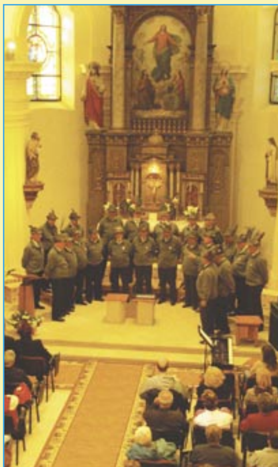
Mužský sbor Alpini Valtanaro z Itálie