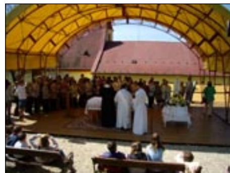
K požehnání maminek naší koclířovské farnosti se připojili i poutníci. Jenom maminky úplně zaplnily celou tribunu. Byl to velmi dojemný pohled. Vzpomínali jsme také na ty maminky, které už nejsou mezi námi. Nakonec všechny maminky dostaly na památku tohoto dne malý dárek i požehnání k jejich životnímu poslání, pro jejich děti i rodiny.