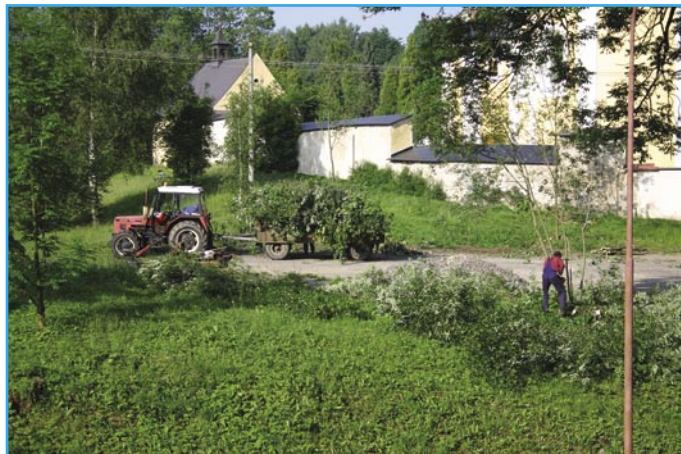
Vyřezávání náletových dřevin v obci.