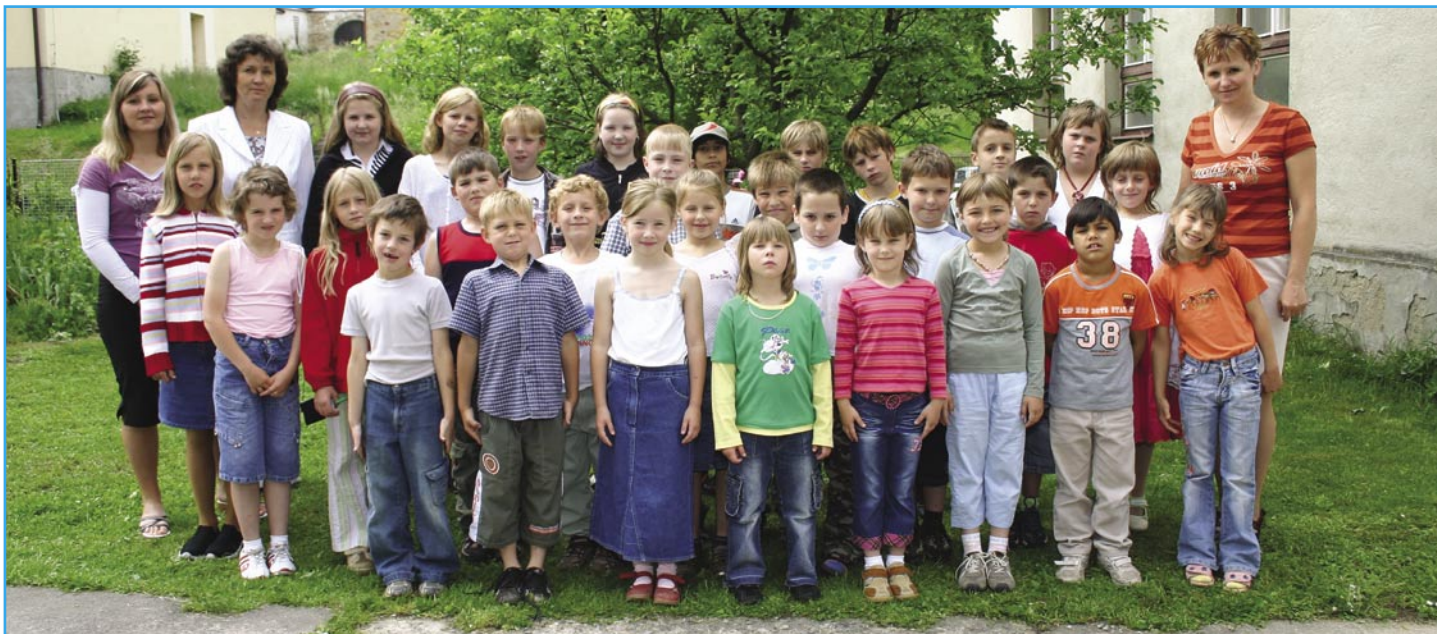
Před ukončením školního roku nesmí chybět společné foto dětí a pedagogického sboru naší školy.