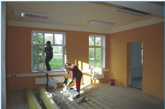
Po třítidenní rekonstrukci se začalo s úklidem a následným stěhováním do kanceláří obecního úřadu.