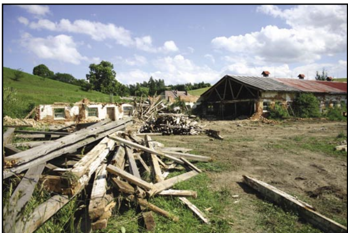
Začala částečná demolice bývalého objektu telezníku. Zbývající část bude sloužit jako svozové místo na pytle s plasty.