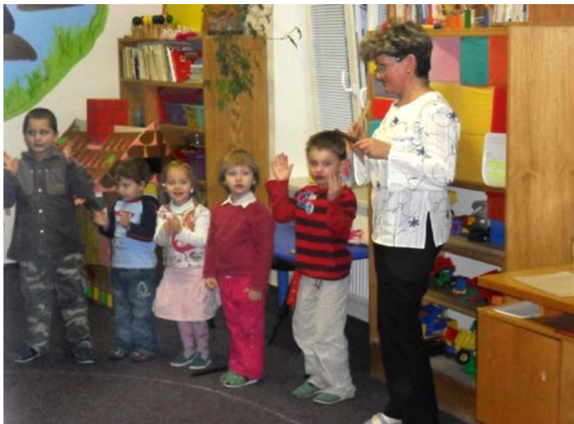
Vánoční besídka v MŠ

Sbor pro občanské záležitosti obce Koclířov přeje všem občanům hodně zdraví, štěstí, pohody a vzájemného porozumění v Novém roce 2012.