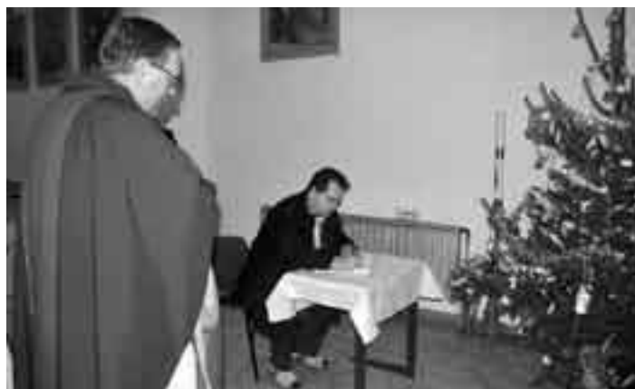
Podpis starosty obce Koclířov do kondolenční knihy