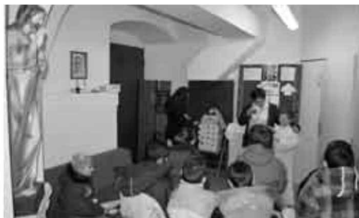
Malá vzpomínka na letošní adventní soutěž, i když na fotografiích chybí pro nemoc hodně dětí, které se do soutěže zapojily