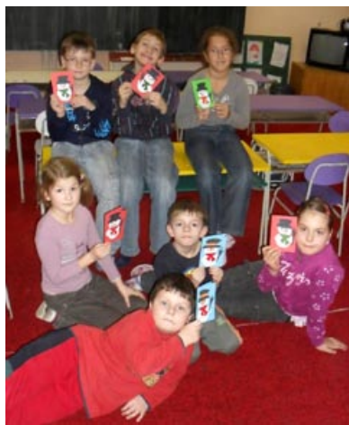
Výroba vánočních přáníček