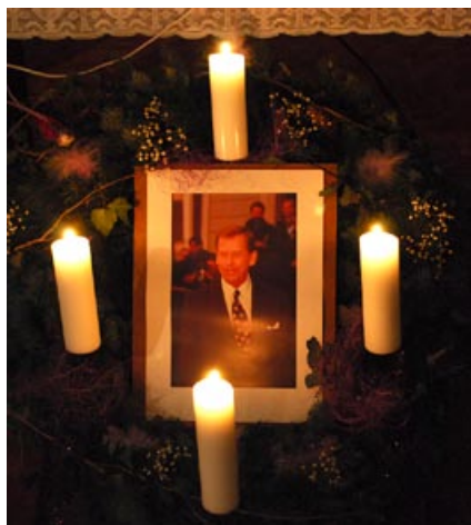
Requiem za Václava Havla