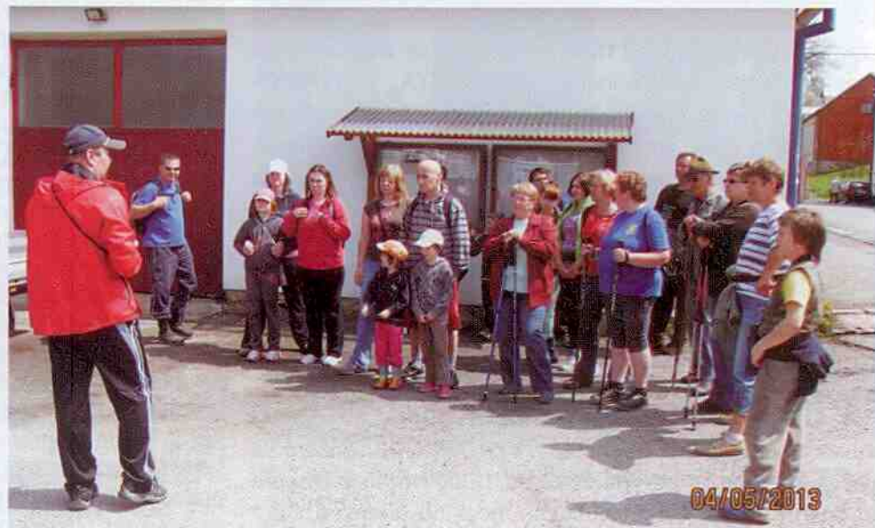
Po roztátných stopách Yettiho se vydala družná výprava