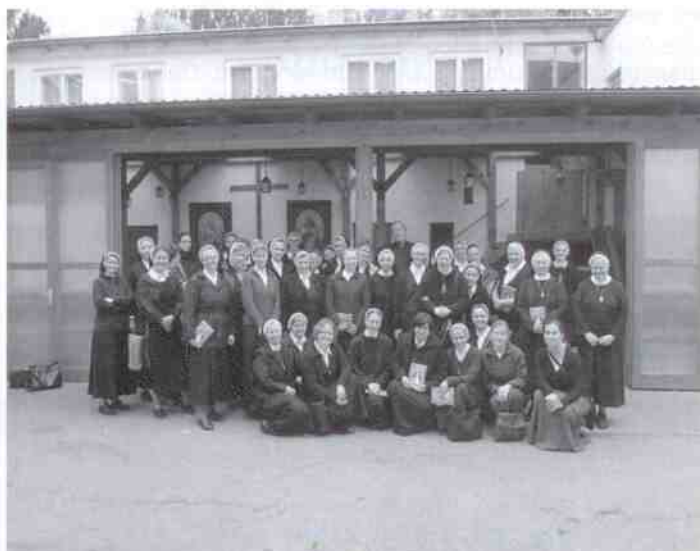
Krásné setkání při vizitaci představených komunit školských sester sv. Františka proběhlo první neděli v květnu