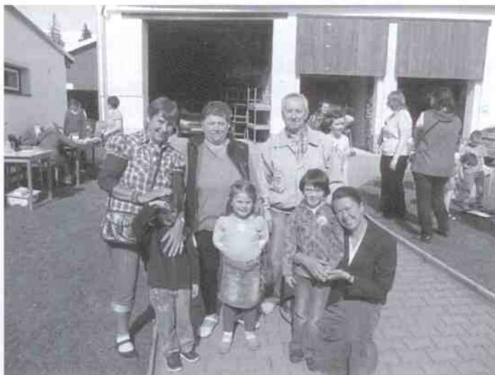
Společné foto jedné tříkrálové skupinky naší farnosti a vzpomínka na krásný program ve Svitavách - poděkování tříkrálovým koledníkům

Prosíme, provázejte modlitbou náročné přípravy pro hlavní akci Roku víry, která po 10 letech (4.10.2003 zasvěcení ČR a odhalení Memoriálu Fatimy v Koclířově) nás znovu mimořádně propojí se světovou Fatimou při slavnostním odhalení Anděla ČR o víkendů 4. - 6.10.2013. Probíhají práce na fasádě ČM Fatimy, položení základního kamene pro sousoší (bude před hlavním vchodem) a další opravy. Vše je velmi náročné, prosíme o modlitby a i, přes finanční pomoc katolické církve není snadné vše potřebné včas připravit. Očekáváme nejen našeho otce biskupa Jana Vokála a pana kardinála Dominika Duku, ale i další osobnosti veřejného a společenského života vzhledem k významu této akce, která zde v Koclířově trvale zůstane zachována.