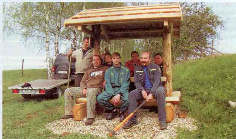
Hasičská parta při dokončení altánku Švihlák na cestě za Čajanem

str.2 Společenská kronika, Vzpomínka, Výstava VČELA – základ života, Obecní knihovna Koclířov informuje str.3 ČM FATIMA A FARNOST Koclířov str.4 ZÁKLADNÍ ŠKOLA A MATEŘSKÁ ŠKOLA KOCLÍŘOV str.5 OS „Naš domov“ Koclířov, Chroustí, Klub mladých informuje... str.6 Hřebečský slunovrat