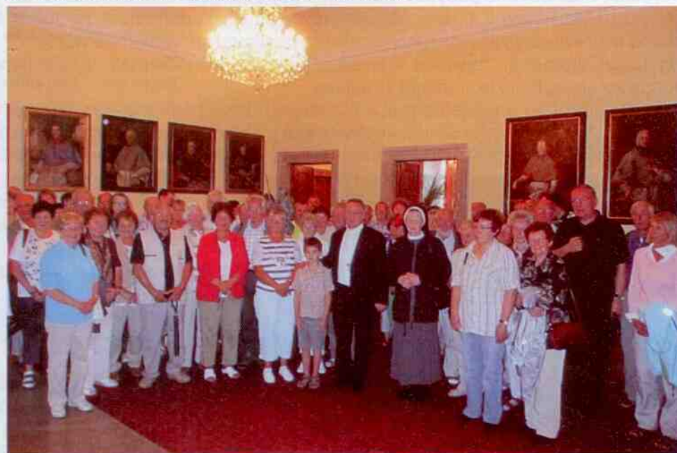
Koclířovští rodáci na audienci u otce biskupa Jana Vokála v Hradci Králové