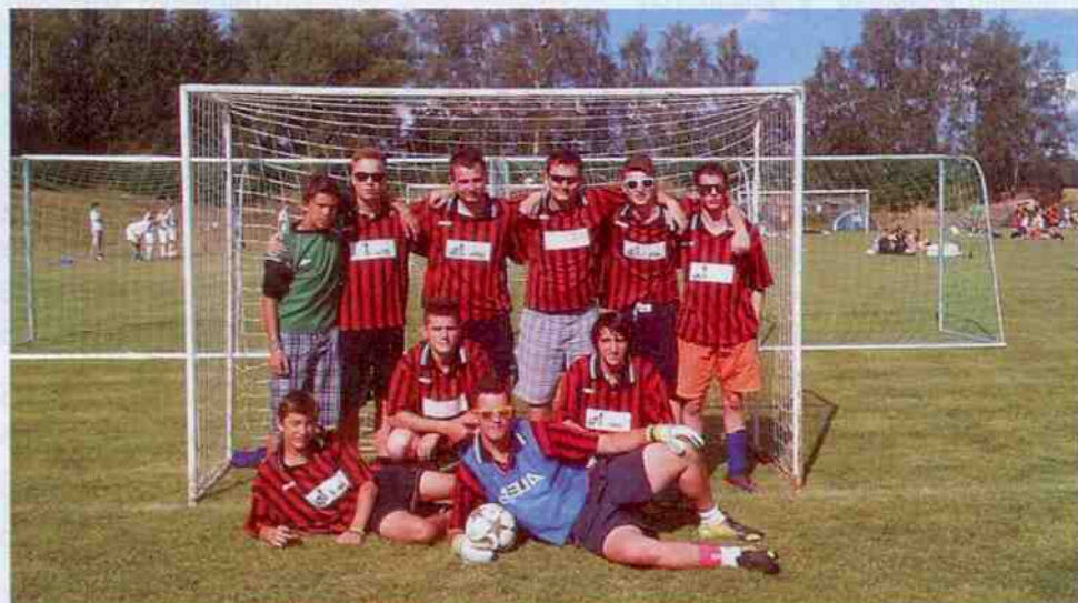
SK FC Koclířov