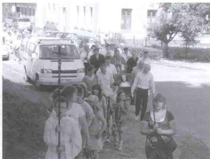
Tradiční procesie se sochou svatě Filomény, patronkou naší farnosti