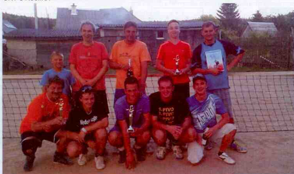
... z nohejbalového turnaje „Kocanda Cup“ 17.08.2013