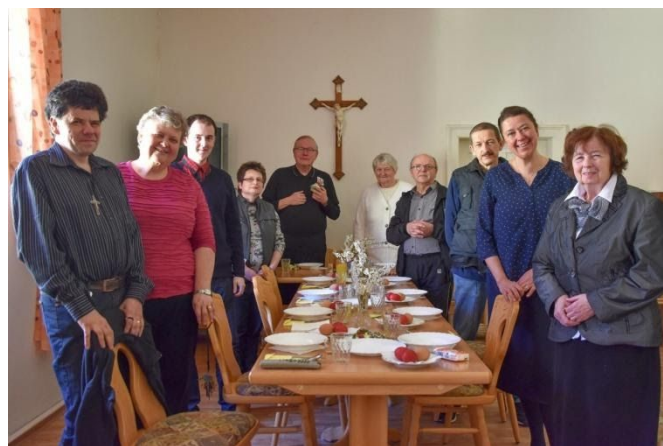
Velikonoční pozdrav od komunity v Českomoravské Fatimě v Koclířově také vám všem.

Zpravodaj vydává obec Koclířov nákladem 350 ks. Obec Koclířov, Koclířov 123, 569 11 IČO: 00276839, občasník, Evidenční číslo MK ČR E 12055., vydáno dne: 27. 4. 2020, č. 5-6/2020, uzávěrka dalšího čísla: 15. 6. 2020, příští číslo zpravodaje vyjde v červenci, periodický tisk územního samosprávného celku. Podepsané příspěvky vyjadřují názory pisatelů a nemusí být totožné s názorem vydavatele. Prošlo redakční jazykovou úpravou. Tisk: Svitavská tiskárna, s. r. o. Redakční rada: Mgr. Michaela Cichá, Mgr. Kateřina Vodehnalová, Eva Veselá