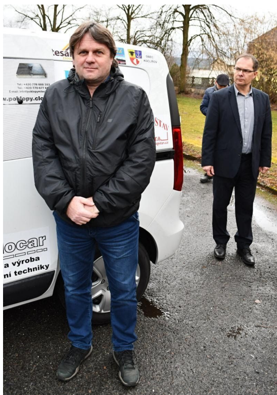
Sociální automobil pro Dětské centrum Svitavy