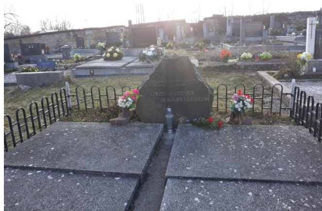
Náhrobní kámen hrobu pěti sovětských zajatců v Opatově je dlouhodobě rozbitý. V sousedním Opatovci o hrob 55 sovětských zajatců obec pečuje.