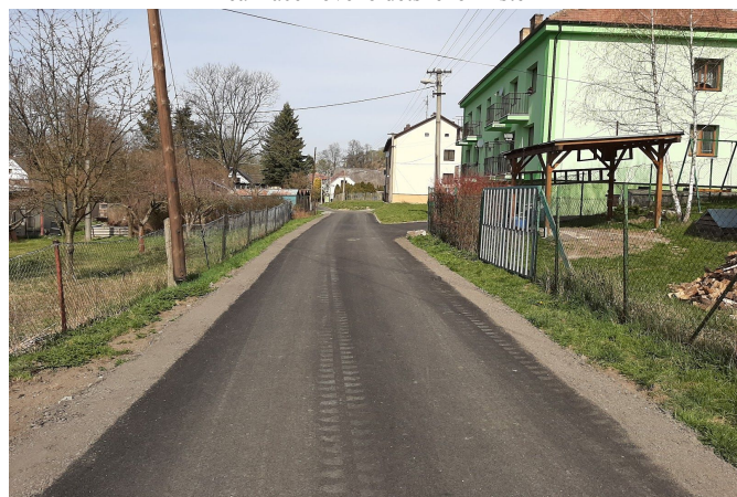
Rekonstrukce zadní komunikace