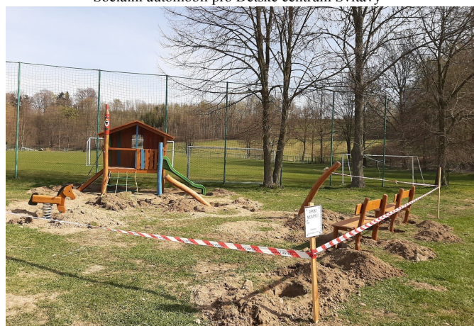
Realizace nového dětského hřiště