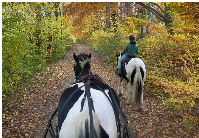
Hubertova jízda 27. 10. 2024