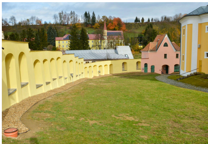
Obnovená ohradní zeď křížové cesty kolem farního kostela