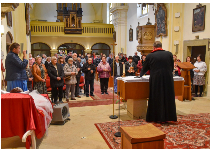
Pobožnost ke cti sv. Filomény ve farním kostele