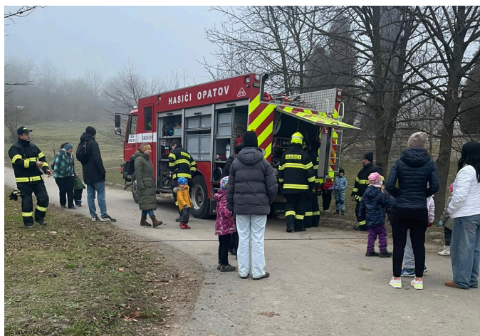
Odpoledne s dětmi z MŠ Koclířov