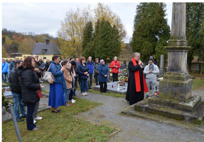
Dušičková pobožnost na farním hřbitově.