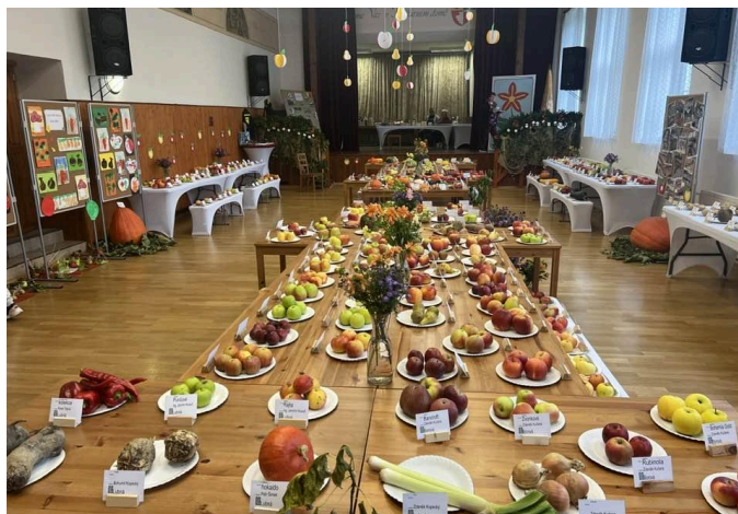
Okresní výstava ovoce a zeleniny v kulturním domě