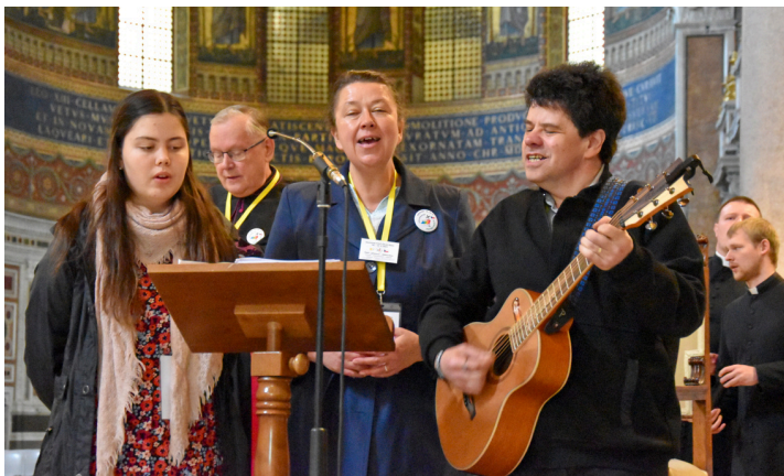
Schola Panny Marie při hudebním doprovodu národní pouti v Římě