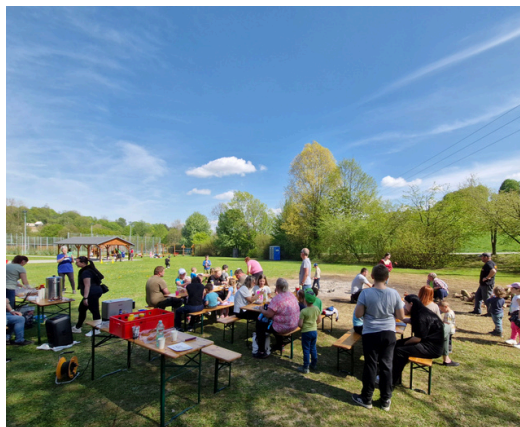
↑ Odpoledne s hasiči ↓