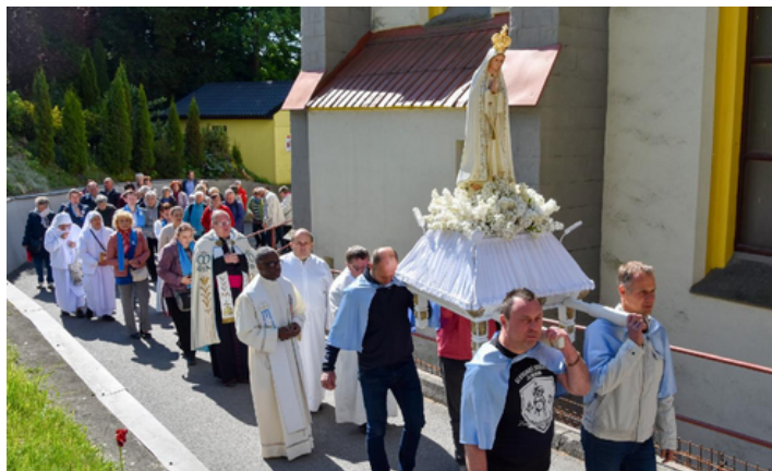
Hlavní fatimský den 13. 5. v Capelinhe s papežským nunciem Mons. Jude Thaddeusem Okolo a delegací z Madarska