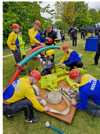
↑ Okrsková soutěž v Dětrichově ↓