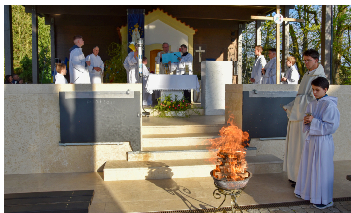
Vigilie vzkříšení u Capelinhy