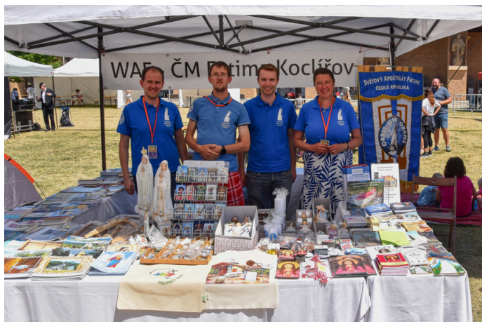
Služba Fatimského apoštolátu na Velehradě v den slavnosti sv. Cyrila a Metoděje.