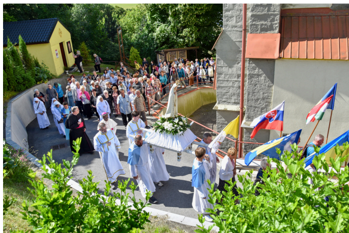
Procesí se sochou Panny Marie Fatimské