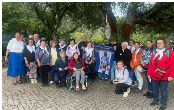
Pout' Fatimského apoštolátu v ČR do Fatimy v Portugalsku