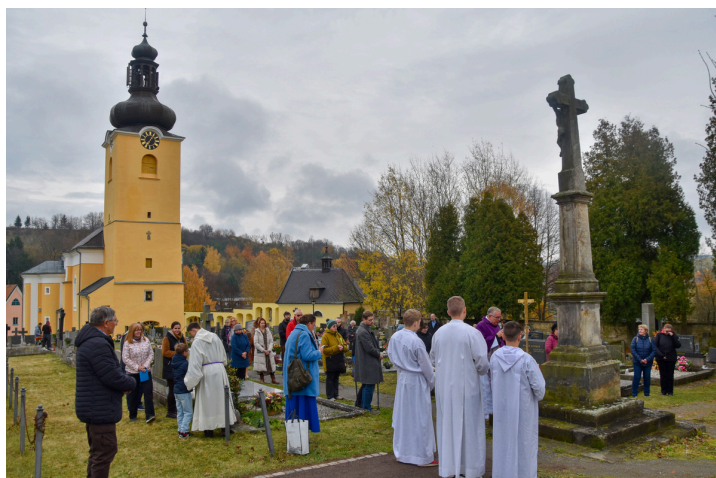
Dušičková pobožnost na farním hřbitově