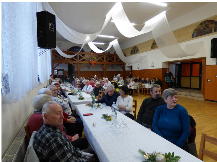
Beseda pro starší a dříve narozené