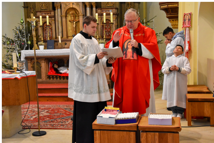
Oslava narozenin sv. Filomény 10. ledna ve farním kostele