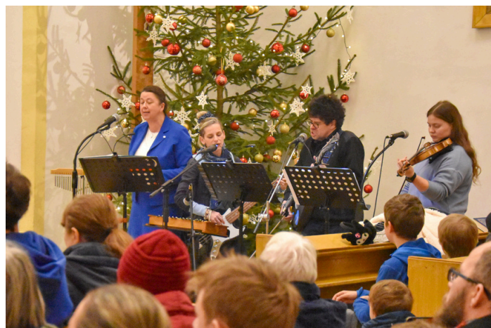
Novoroční koncert Scholy Panny Marie