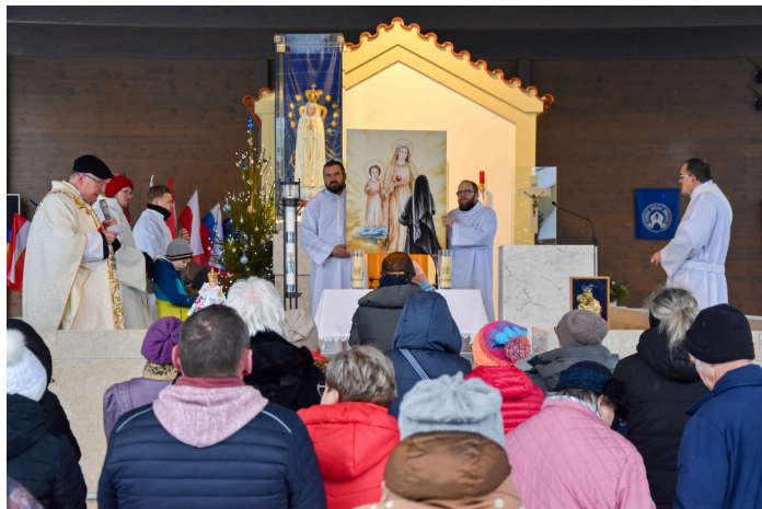
Zahájení století Pontevedra v Capelinhe s představením nového obrazu Zjevení Panny Marie s dítětem Ježíšem sestře Lucii de Santos