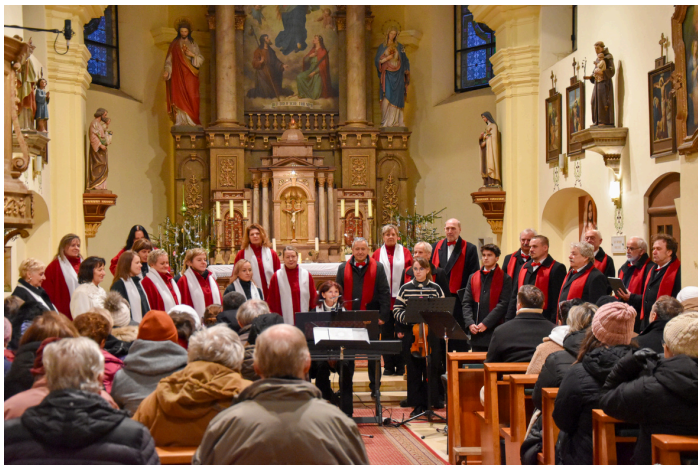
Tradiční vánoční koncert sboru Dalibor ve farním kostele sv. Jakuba a Filomény